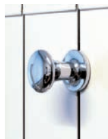
A237 poignée blanche A238 poignée chromée