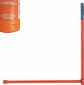
A079 barre à nippler A080 rallonge 500 mm pour barre A081 rallonge 800 mm pour barre