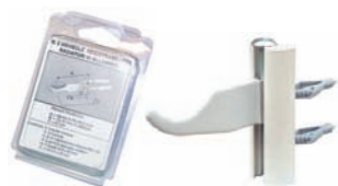
A027 consoles universelles blanches blister (paire)