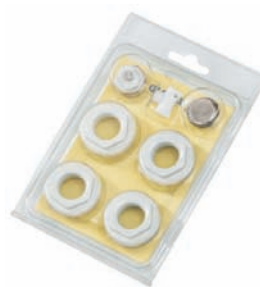
KIT RÉDUCTIONS AVEC JOINT SILICONE ET PURGEUR ORIENTABLE A043 3/8" blanc ou chromé pour radiateurs de 200/D à 800 mm A046 1/2" blanc, chromé ou couleurs spéciales pour radiateurs de 200/D à 800 mm A048 3/4" blanc ou chromé pour radiateurs de 200/D à 800 mm