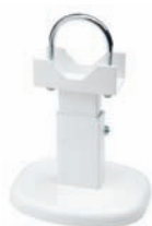
A015 console à pied blanche