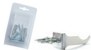
A029 consoles équerre à visser blanches blister (paire)