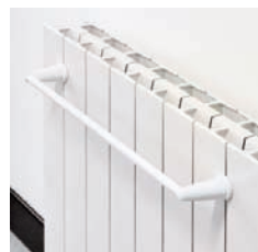
BARRE PORTE SERVIETTE